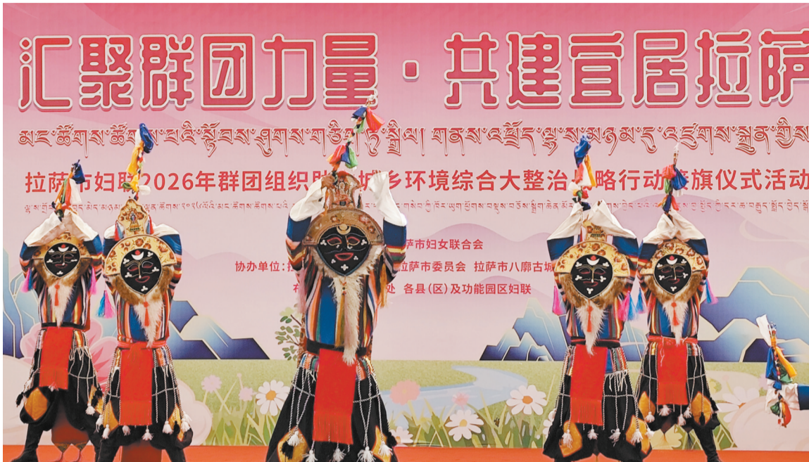
图为启动仪式现场,演员进行藏戏文艺演出。