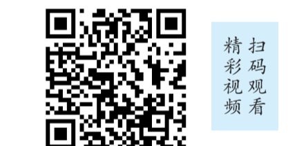
扫码观看精彩视频

行路指引如下:红旗西路:因道路封闭施工,来往车辆请暂时从江苏东路(南北向)、藏大西路(东西向)绕行。红旗东路:来往车辆请暂时从藏热南路(南北向)、拉定路(南北向)、藏大中路(东西向)绕行。拉萨交警温馨提示,请广大驾驶员提前规划出行路线,途经管制区域及周边路段时减速慢行、注意避让,服从现场工作人员指挥,按照交通标志、标线有序通行。