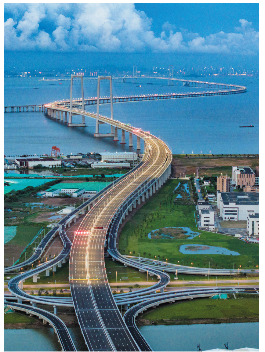
这是6月27日,华灯初上时的深中通道(无人机照片)。